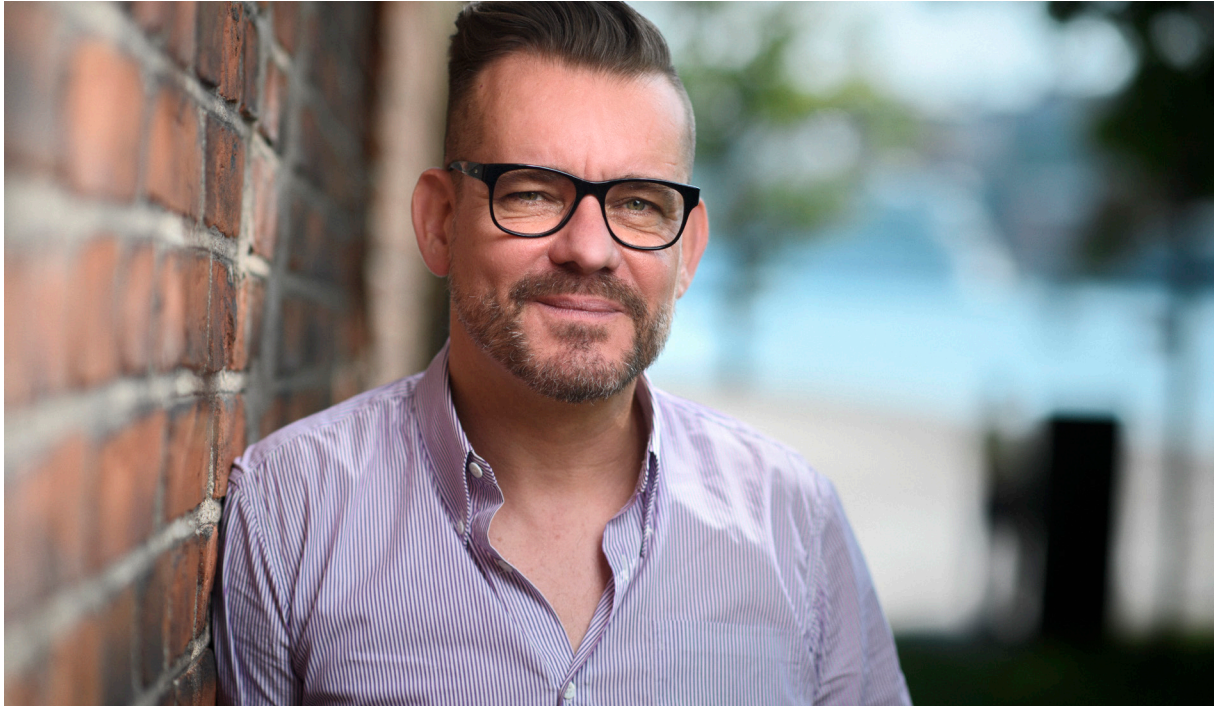
Bart Moeyaert.

Den belgiske författaren Bart Moeyaert fick Litteraturpriset till Astrid Lindgrens minne 2019. Moeyaert är en mångfaldigt belönad författare som debuterade som 19-åring 1983, och som därefter publicerat runt 50 titlar i olika genrer. I Moeyaerts produktion finns bilderböcker, romaner, poesi, dramatik, sångtexter, TV-manus och essäer. Bart Moeyaert översätter också barn- och ungdomslitteratur till nederländska, har verkat som stadspoet i Antwerpen (2006–2007) och är känd som en skicklig föreläsare.